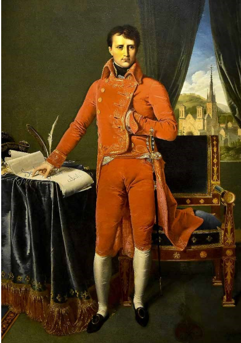
Førstekonsul Napoleon Bonaparte (1769-1821). Portrættet er fra 1803-04. I disse år bakkede de fleste franskmænd og mange på den italienske halvø op om hans politik, som var baseret på erfaringerne fra 1700-tallets oplysningstid. Maleri af Jean-Auguste-Dominique Ingres. Musée Curtius, Liège.